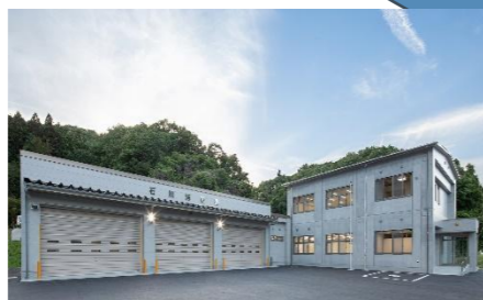
石川消防署庁舎(設計・積算・工事監理)