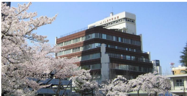
本部 〒960-8043 福島市中町7番17号（ふくしま中町会館）