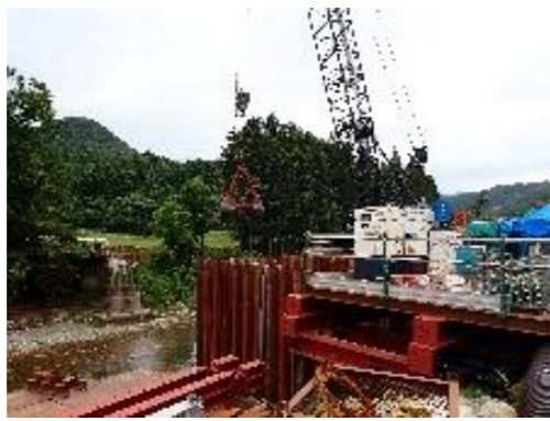
相馬市茄子小田橋災害復旧工事(設計・積算・工事管理)