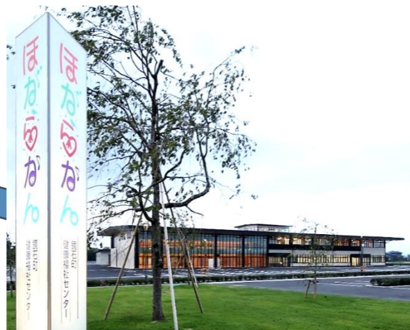
鏡石町健康福祉センター (基本計画・設計・積算・工事監理)