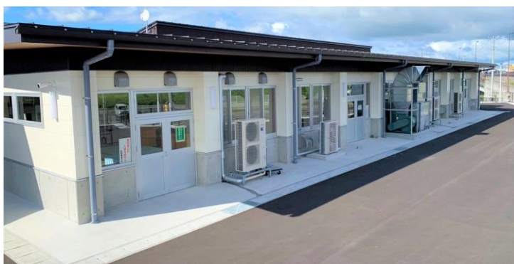
試験審査所 〒963-8047 郡山市富田東二丁目245番地