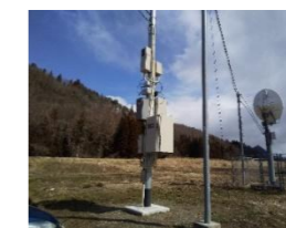
昭和村ラジオ難聴解消事業(積算・工事管理)