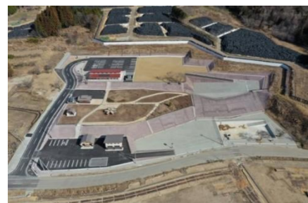
飯館村長泥地区居住促進ゾーンの造成工事、集会施設等の整備工事(設計・積算・工事管理(監理))