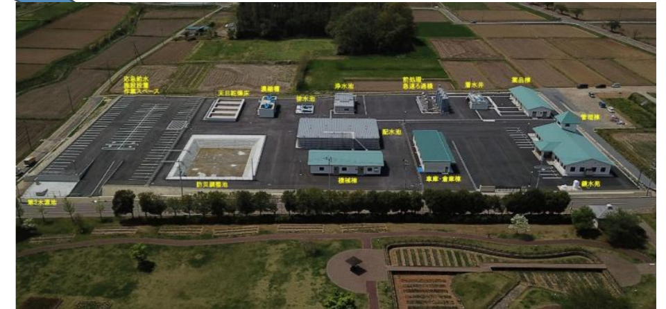
鏡石町鏡石浄水場(積算・監督員支援)