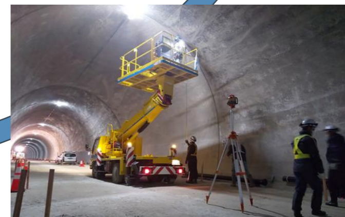
道路橋りょう整備工事(博士トンネル設備工事) (積算・工事管理)