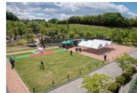
本宮市英国庭園イベント 広場整備工事(設計・積算・工事管理)