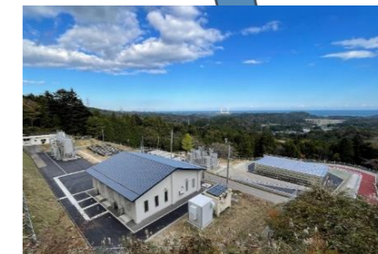
双葉地方水道企業団小滝 平浄水場改修工事(設計・ 積算・工事管理)