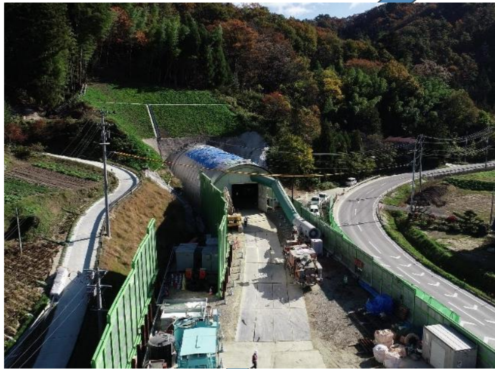
福島県国道 114 号関場トンネル本体工事(積算・監督員支援)