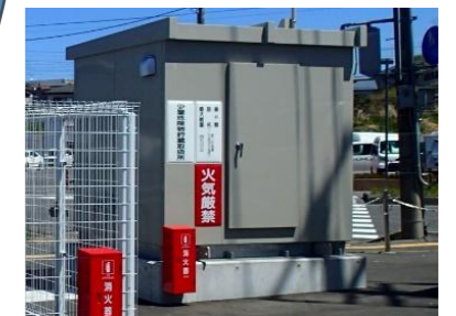
須賀川地方広域消防組 合非常用電源設備工事 (設計・積算・工事管理)