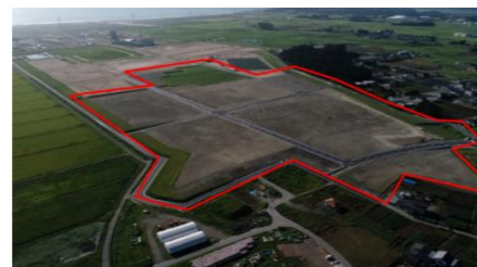
南相馬市復興工業団地第 2 期造成工事(積算・工事管理)