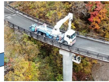
飯館村堰堤橋点検業務