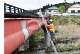
富岡町水管橋点検業務