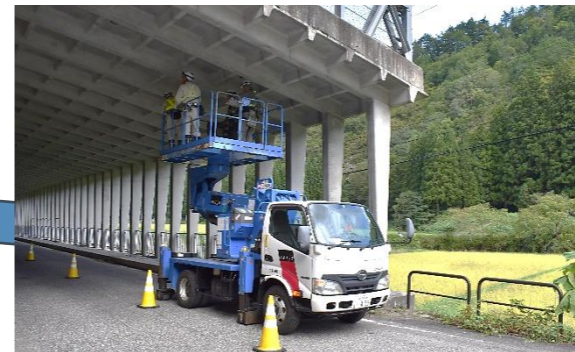
只見町塩ノ岐スノーシート点検業務